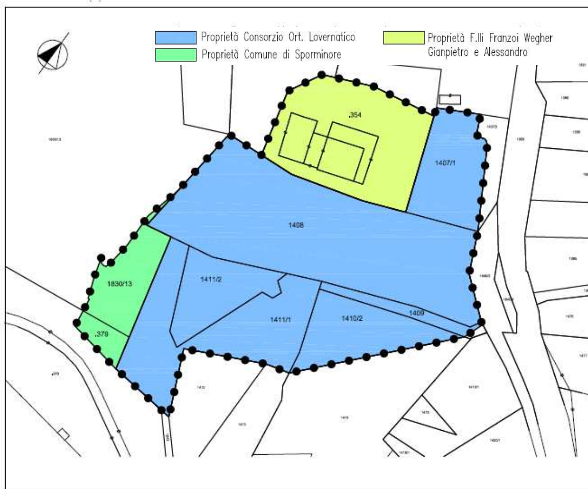
Fig. 2 – Mappa catastale con perimetrazione delle particelle coinvolte nel progetto di variante.

La p.ed.379 risulta libera da vincoli, mentre la p.f. 1830/13 risulta soggetta a vincolo di uso civico. 1